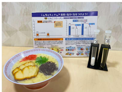
《とんこつラーメン》