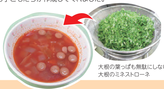
大根の葉っぱも無駄にしない! 大根のミネストローネ

店頭に並ぶ大根は、流通の関係で葉を落としています。子どもたちは、大蔵大根を育てたことで大根の葉を捨てるなんてもったないと、大根をすべて使い切る料理を自ら考えてくれました。まさに大根愛に満ち溢れていました。また、毎日給食時に提供する給食のおたよりも子どもたちが作成してくれました。