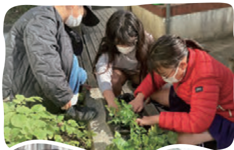
玉川小学校の大蔵大根

間引きした大根を家に持ち帰り、料理をしている動画をタブレットに送ってくれる子どもや保護者からは「家では全く葉物を食べないのに、間引きした大根は食べていたんですよ。」「大根料理を子どもと一緒に料理をしています。」など、うれしい報告もありました。