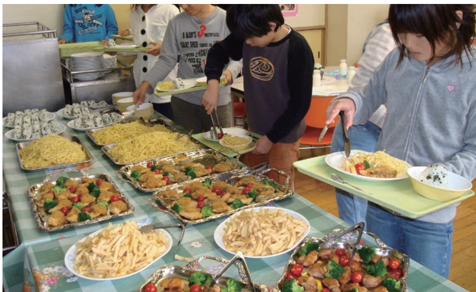
パイキング給食の様子